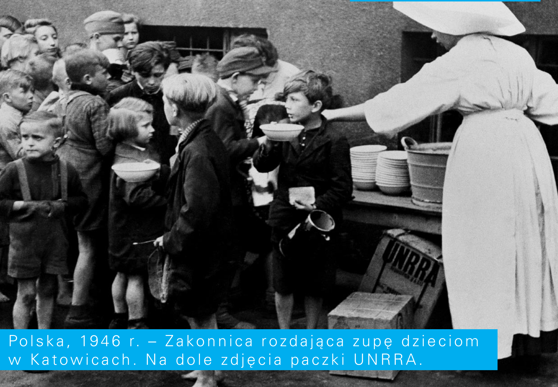
Polska, 1946 r. – Zakonnica rozdająca zupę dzieciom w Katowicach. Na dole zdjęcia paczki UNRRA.