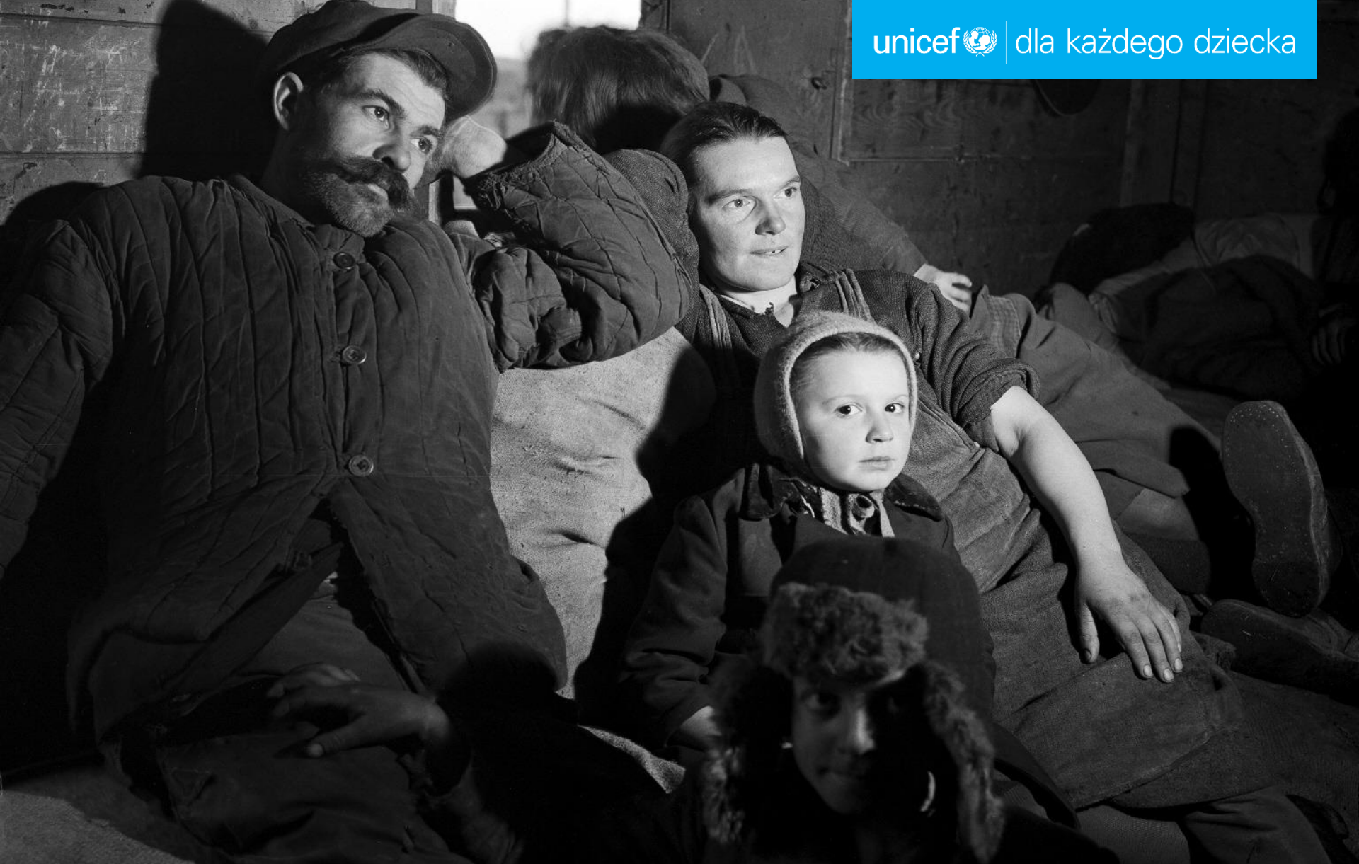
Polska, 1946 r. - Rodzina uchodźców w pociągu towarowym jedzie z okolic Lwowa na Dolny Śląsk.